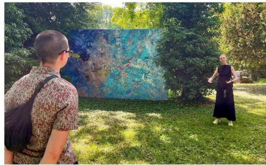
Pantin, jeudi. L'exposition va évoluer au fil des saisons.

* Entrée gratuite. Accessible sur les horaires d'ouverture du cimetière.