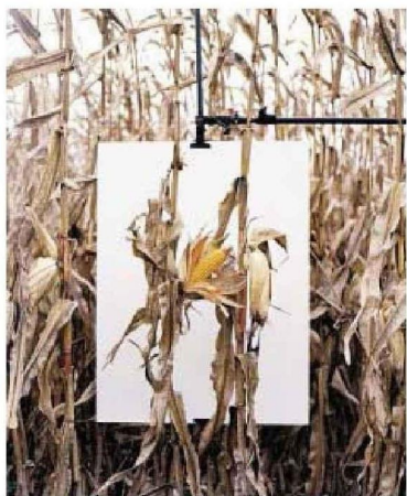
Ci-contre : Van Buren, Indiana (détail), 2013, photo de Mathieu Asselin.